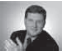
Der Ortsvorsteher informiert: